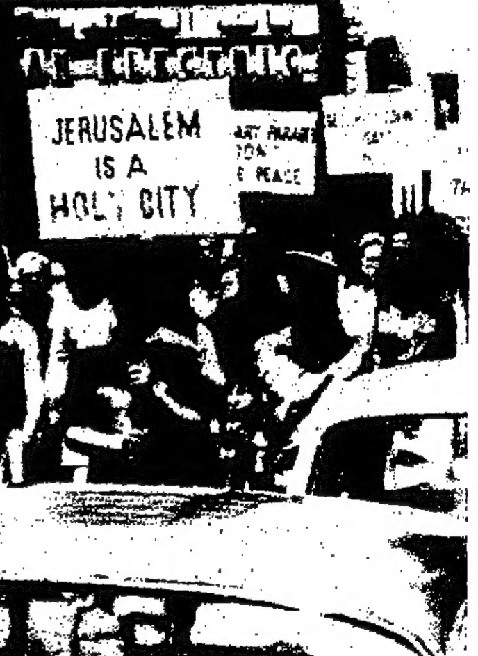
الزيارات السياحية التي تجذب السياح في مدينة القوس

اعلان توظيف تعلن وكالة ايوب التجارية بعمان عن حاجتها لوظف ويشترط في المتقدم ان يجيد اللغتين العربية والانجليزية ويفضل من له بعض الالام باللغة الفرنسية . تقدم الطلبات خطيا بواسطة صندوق بريد ١٧ عمان او بالظهور شخصيا الى مكتب الشركة الكائن في ساحة الجريد من الساعة ١٠-١ ظهرا ومن ٤-٤ مساء الادارة